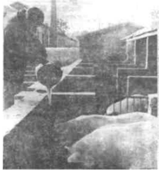
东营黄河修防段工会积极发展多种经营，兴办种植养殖业，每年增加收入达30多万元，闯出了一条向事业经营型发展的路子。

四、棉花生产扶持费和(据《中国农村百业信息报》)价格补贴，均在国家规定的价格基础上加价。按标准级皮辊棉计算，1988年度调整后的收购价格，由现行的每50公斤16.42元提高到21.42元；产棉县棉花供应价格，由现行的12元提高到20元。棉花供应价格提高的部分，工业用棉定购要由工厂消化，民用絮棉价格相应提高。